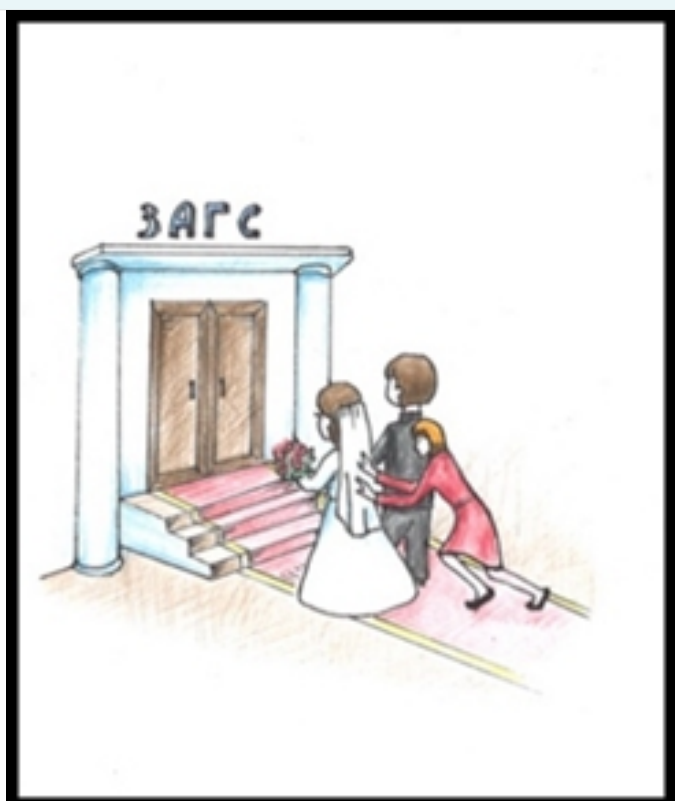
Рис. 3. Что значит не хочу? А ну вперед, а то домой не пушу!

1. Презумпция отцовства. Если ребенок был рожден в браке, или в течение 300 дней после расторжения брака, то отцом ребенка будет считаться муж/бывший муж. Юридическое значение данной презумпции заключается в упрощении процедуры установления алиментного содержания детей, а также субъектов, несущих ответственность за воспитания детей. Эта презумпция была установлена в целях поддержки института семьи и уменьшения издержек в правовых спорах.