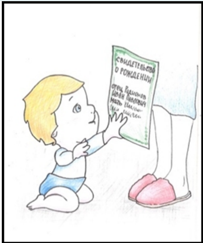
Рис. 1. И кто же мой папа?

С учётом изложенного, внимательно рассмотрите рисунки и опишите жизненные ситуации, которые представлены в каждом из них. Укажите или сформулируйте правовые презумпции, регулирующие отношения в каждой из описанных вами жизненных ситуаций. Каково юридическое значение данных правовых презумпций и в каких целях они были установлены законодателем?