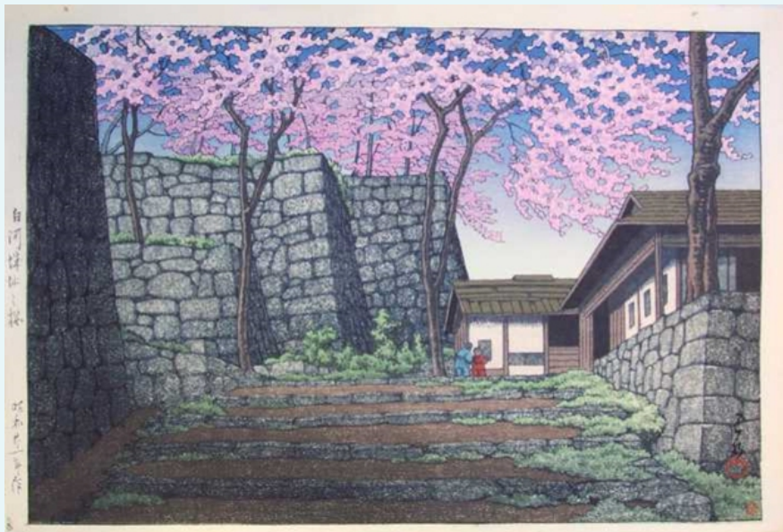
(гравюра Hasui Kawase, 1946)

(ответ на данное задание оценивается в рамках Олимпиады школьников «В мир права» и одновременно в рамках Конкурса олимпиадных работ школьников на призы Следственного комитета Российской Федерации)