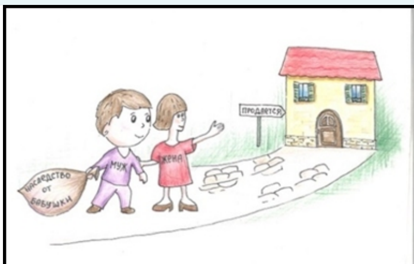
Рис. 2. Собственники.